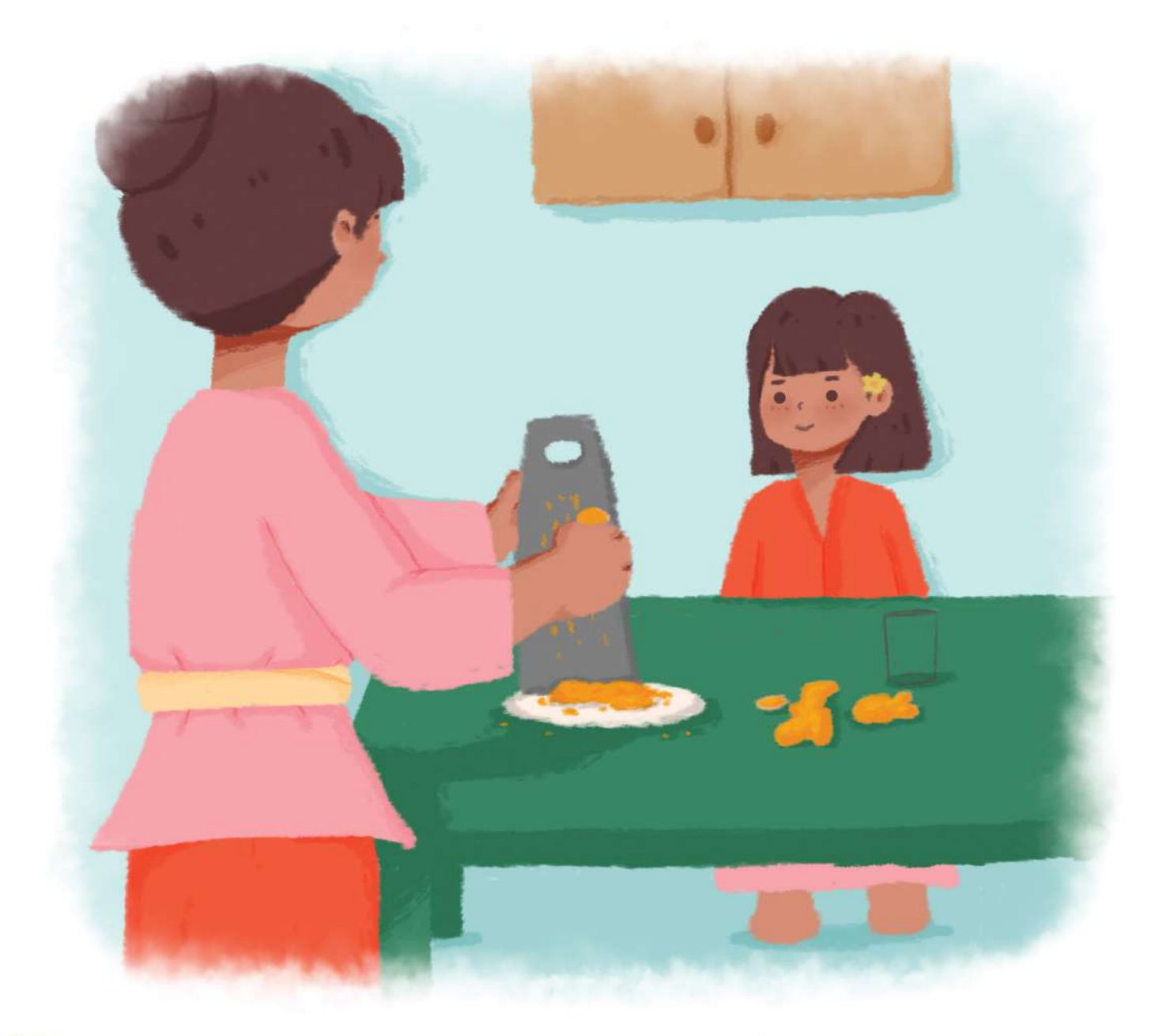
Ibu mengambil parutan yang ada di lemari. Kunyit lalu diparut sampai halus.