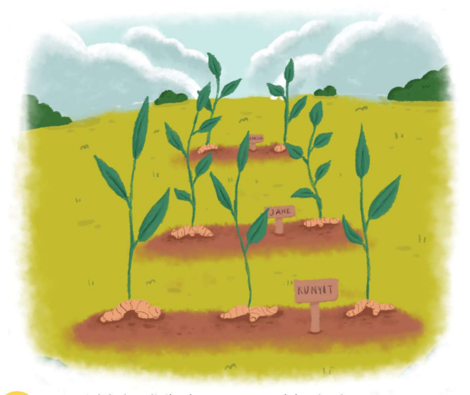
Selain kunyit, Ibu juga menanam jahe dan kencur. Ibu suka menanam rempah-rempah untuk obat tradisional.