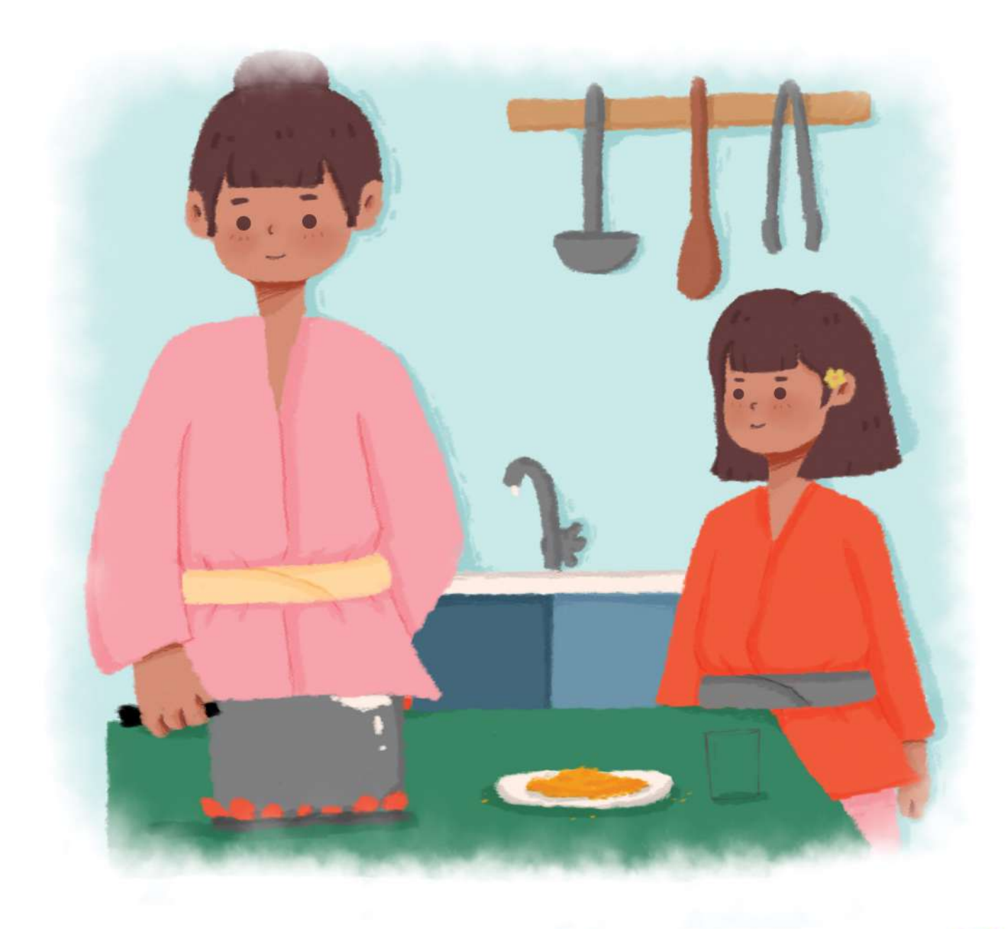
Kemudian, Ibu mengambil panci yang berisi air. Parutan kunyit dimasukkan kedalam panci, kemudian dipanaskan.