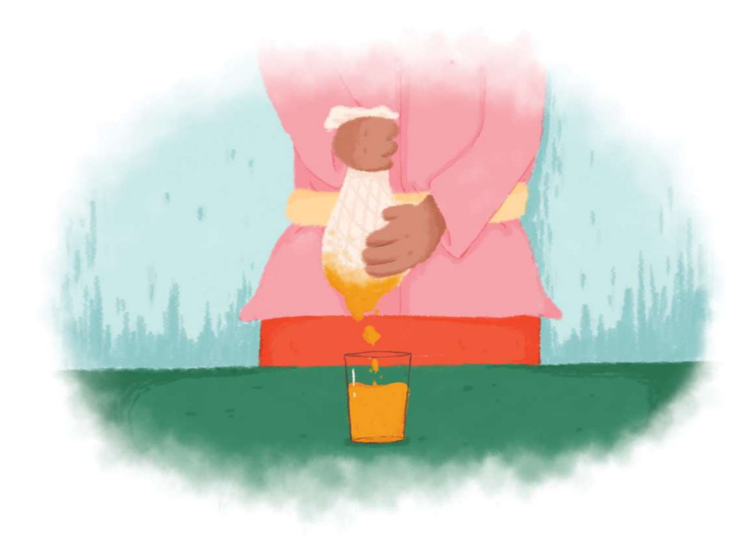
Setelah beberapa menit, air menjadi mendidih lalu disaring.