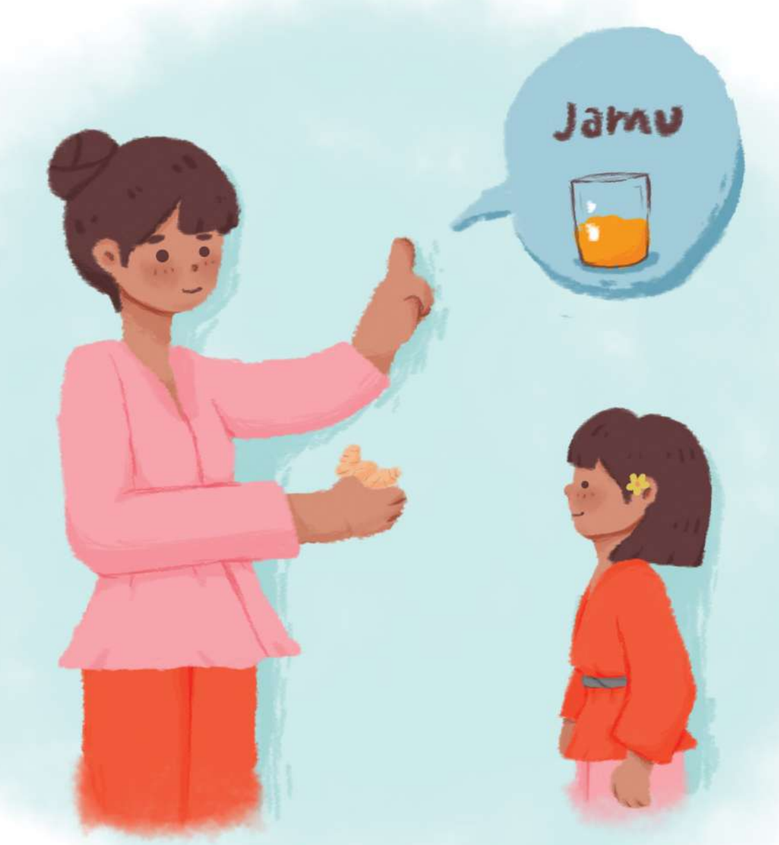
Ibu lalu menjelaskan kepada Sekar. Kunyit adalah rempah-rempah untuk membuat jamu. Jamu kunyit adalah salah satu obat tradisional. Jamu kunyit bisa mengobati batuk.