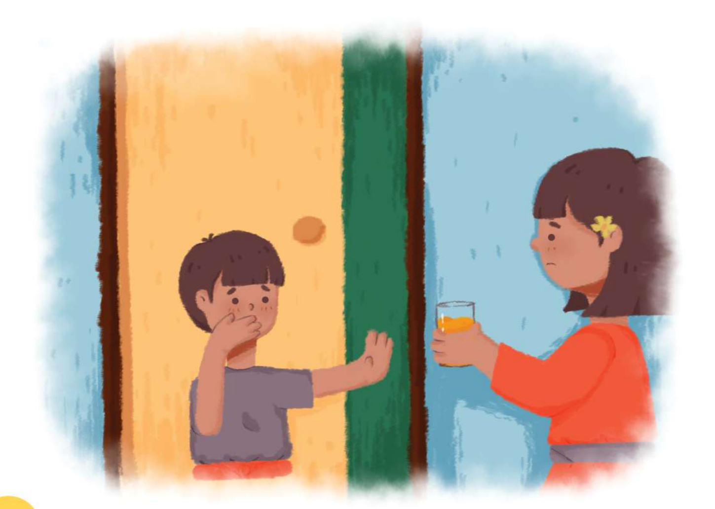
Sekar memberikan secangkir jamu kunyit kepada Adi. Tetapi Adi tidak mau minum jamu itu. Kata Adi jamu itu pahit.