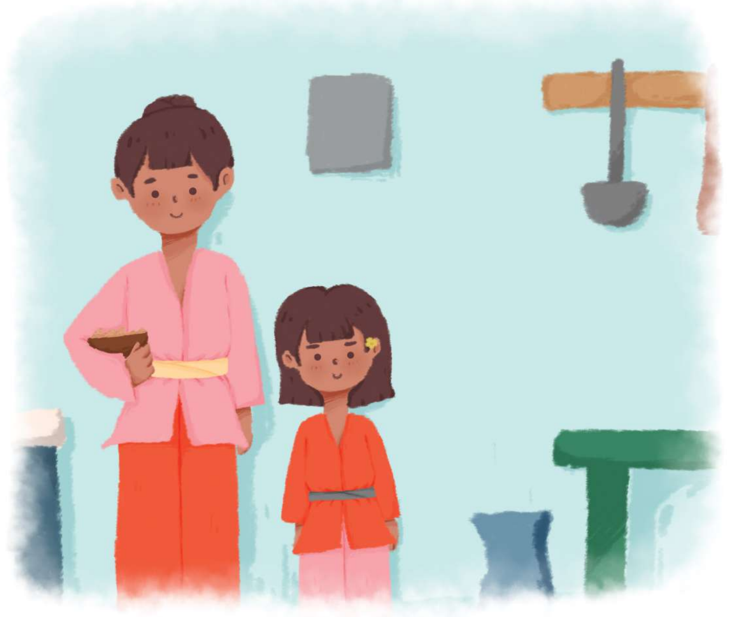
Ibu dan Sekar kembali ke dapur. Sekar memperhatikan cara Ibu membuat jamu kunyit.