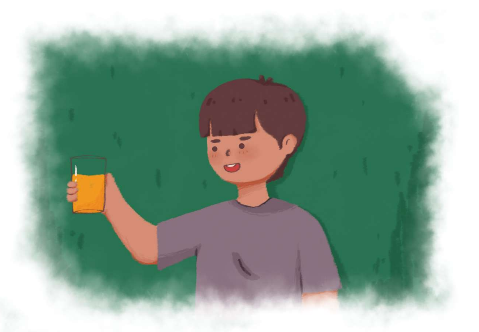
Ternyata Adi suka! Jamu kunyit terasa enak karena sudah dicampur madu. Adi menghabiskan jamu kunyit dengan cepat.